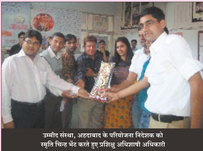
उम्मीद संस्था, अहमदाबाद के परियोजना निदेशक को स्मृति चिन्ह भेंट करते हुए प्रशिक्षु अधिशाषी अधिकारी

Solid Waste Treatment Plant:- सूरत का SWTP BOT आधार पर संचालित प्लांट है जिसका संचालन 'हैनरेज इण्डिया प्राइवेट लिमिटेड' नामक कम्पनी द्वारा किया जा रहा है। प्लांट का पूरा नियंत्रण कम्प्यूटराइज्ड है तथा दो चरणों में कचरा प्रोसेस किया जाता है। प्रथम चरण में प्लांट की कचरा ग्रहण क्षमता 500 मी. टन है जबकि द्वितीय चरण में 1000 मी. टन कचरे का प्रोसेस किया जा सकता है। इस प्रक्रिया में 75 प्रतिशत कचरा पुनः संशोधित हो जाता है तथा शेष कचरे को लेण्ड