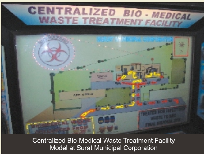
Centralized Bio-Medical Waste Treatment Facility Model at Surat Municipal Corporation

कार्यशाला का आयोजन:- सिटी मैनेजर्स एसोसिएशन गुजरात, अरबन मैनेजमेन्ट सेन्टर, अहमदाबाद नगर निगम के संयुक्त तत्वावधान में प्रशिक्षणार्थियों के लिये अहमदाबाद नगर निगम के पश्चिमी जोन कार्यालय में एक दिवसीय कार्यशाला का आयोजन किया गया। इस कार्यशाला में सिटी मैनेजर्स एसोसिएशन गुजरात के कार्य, अहमदाबाद