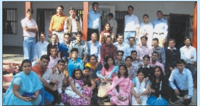
हृदय कुंज, साबरमती आश्रम, अहमदाबाद में प्रशिक्षु अधिशाषी अधिकारी व अन्य अधिकारीगण

प्रदेश शहरी निकायों के लिए नवचयनित अधिशाषी अधिकारियों का प्रशिक्षण 2 सितम्बर को हरीश चन्द्र माथुर राजस्थान राज्य लोक प्रशासन संस्थान में शुरू हुआ। राजस्थान राज्य लोक सेवा आयोग द्वारा 60 अधिशाषी अधिकारियों का चयन हुआ है। जिसमें से 22 महिला अधिकारी हैं, जो कि नगर निकायों के लिए उत्तम है। इससे निकायों में कार्य गति से होंगे। इन अधिकारियों को हरिशचन्द्र माथुर राजस्थान राज्य लोक प्रशासन संस्थान में प्रोजेक्ट बनाना, म्यूनिसिपल एकाउंटिंग, सीवरेज, ड्रेनेज, टारुन प्लानिंग, नगर निकायों के कार्यों, योजनाओं, राजस्थान नगर पालिका कानून की विस्तृत जानकारी प्रशिक्षण अवधि में