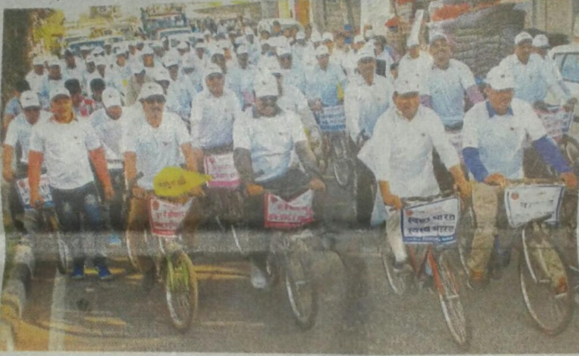
साइकिल रैली निकालते नगर निगम के कर्मचारी।